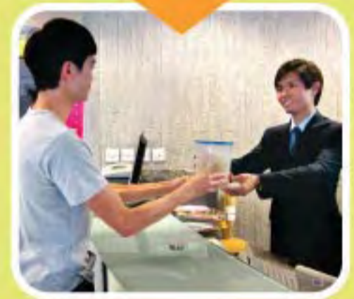
Basurang pagkain ay dinadala sa Pinagsamang Punto ng Pagkolekta ng mga residente