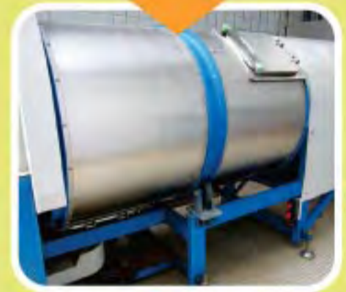
Ang basurang pagkain ay nililipat at nilalagay sa kagamitang pang-compost ng kawani ng mga estate ng pamamahay