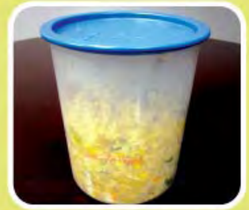
Paghiwalay ng pinagmulan ng pagkaing basura ng mga residente