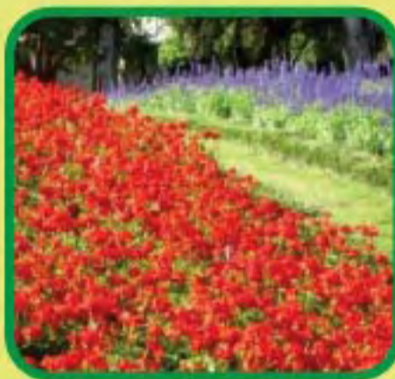
Ang kompost ay maaaring gamitin sa pag-landscape

Maaaring direktang mabawasan ng pagresiklo ng basurang pagkain ang dami ng basurang itatapon sa mga landfill. Ang basurang pagkain ay maaaring maresiklo sa kompost sa pamamagitan ng kagamitan sa pag-kompost sa mga estate ng pamamahay. Ang kompost ay magagamit bilang organic na fertilizer o pangkondisyon ng lupa, na may mas balanseng nilalamang nutrisyon kaysa sa kemikal na pataba at makakatulong na pabutihin ang mga ari-arian ang lupa. Ang mga estate ng pamamahay ay maaaring makapag-apply ng kompost sa mga tanim para sa pag-landscape.